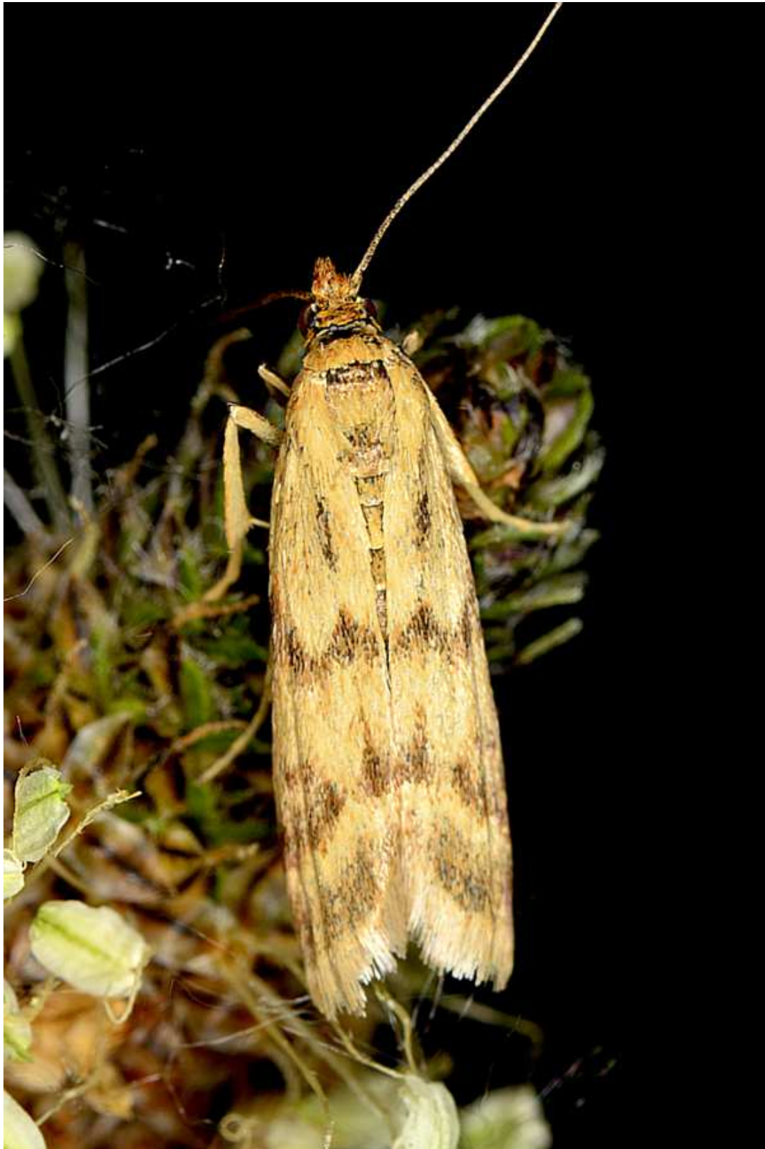
Homeosoma sinuella (Fabricius, 1794) – Pyralidae