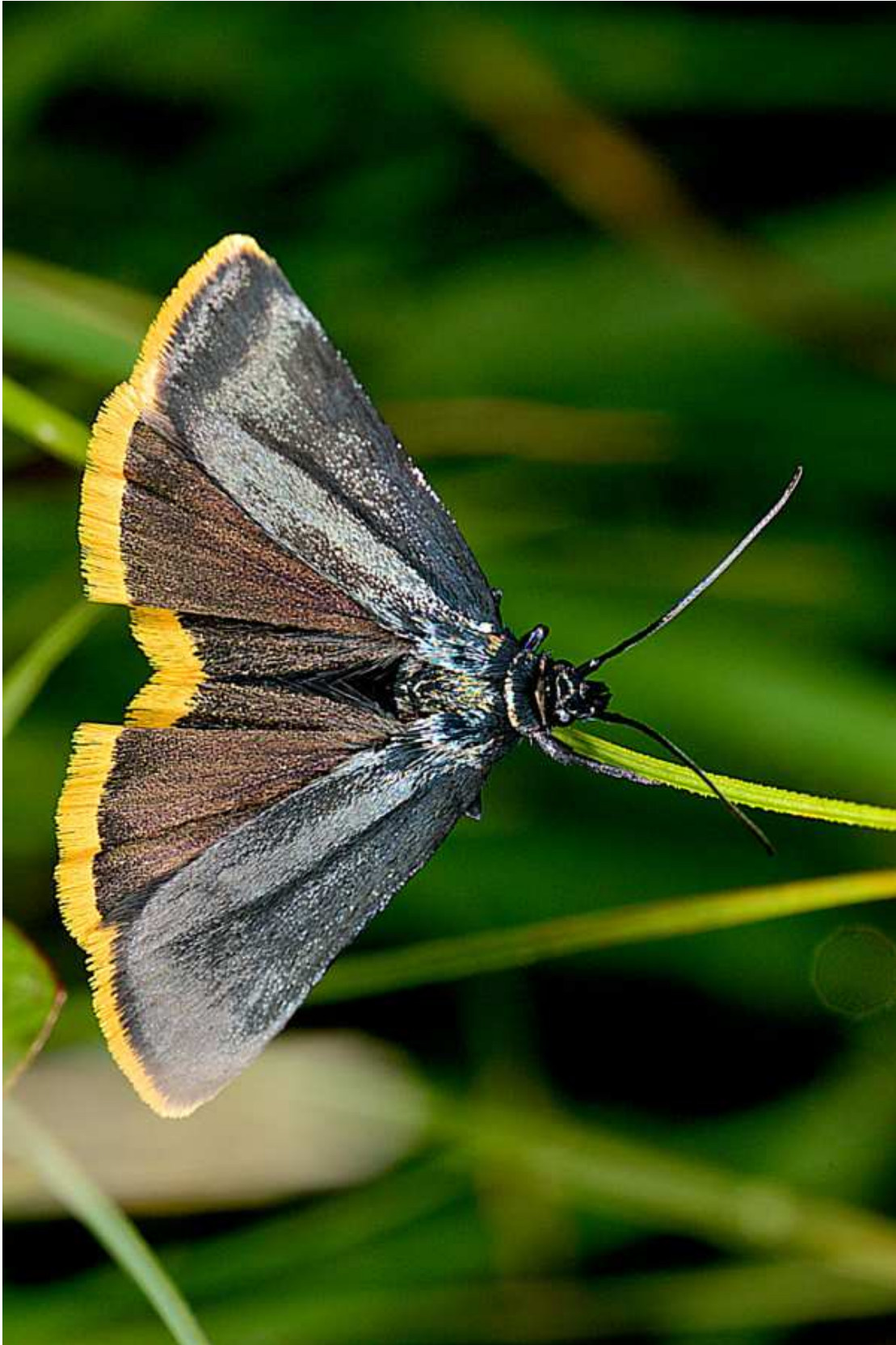
Harpella forcicella (Scopoli, 1763) – Oecophoridae