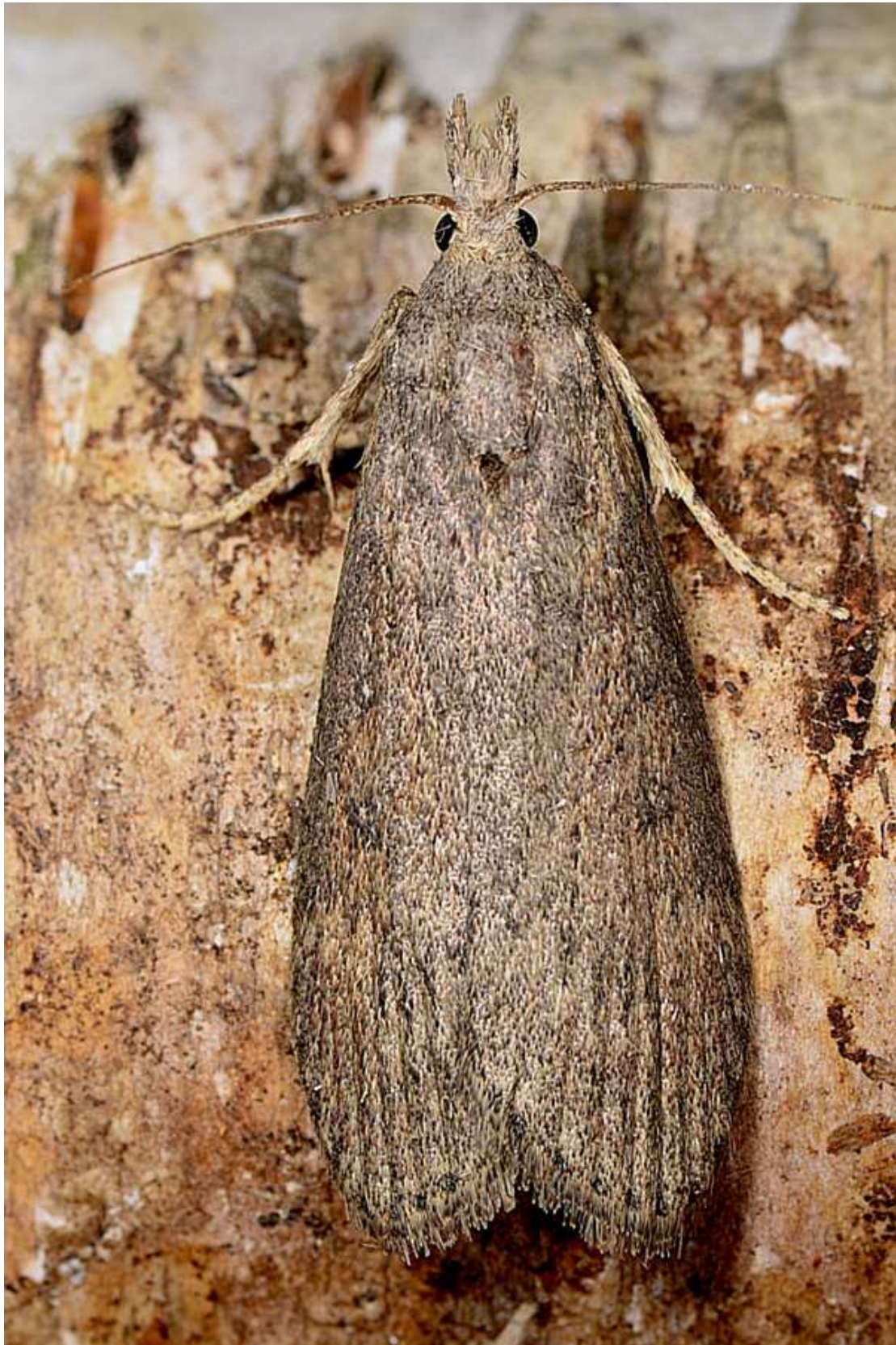
Lamoria anella (Denis & Schiffermuller, 1775) – Pyralidae