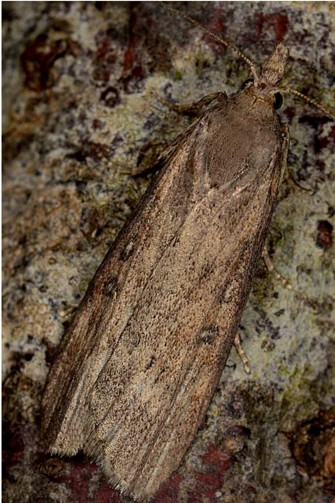
Lamoria zelleri (De Joannis, 1932) – Pyralidae