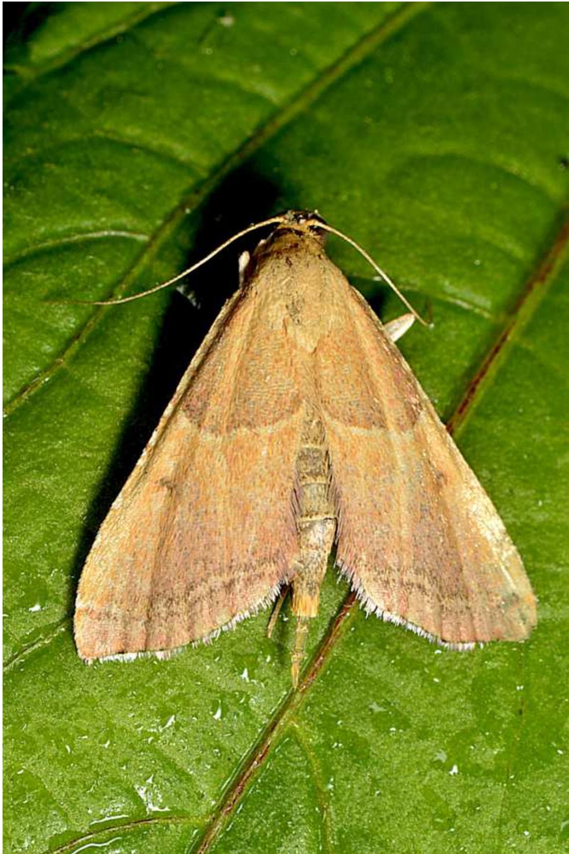
Endotricha flammealis (Denis & Schiffermuller, 1775) – Pyralidae