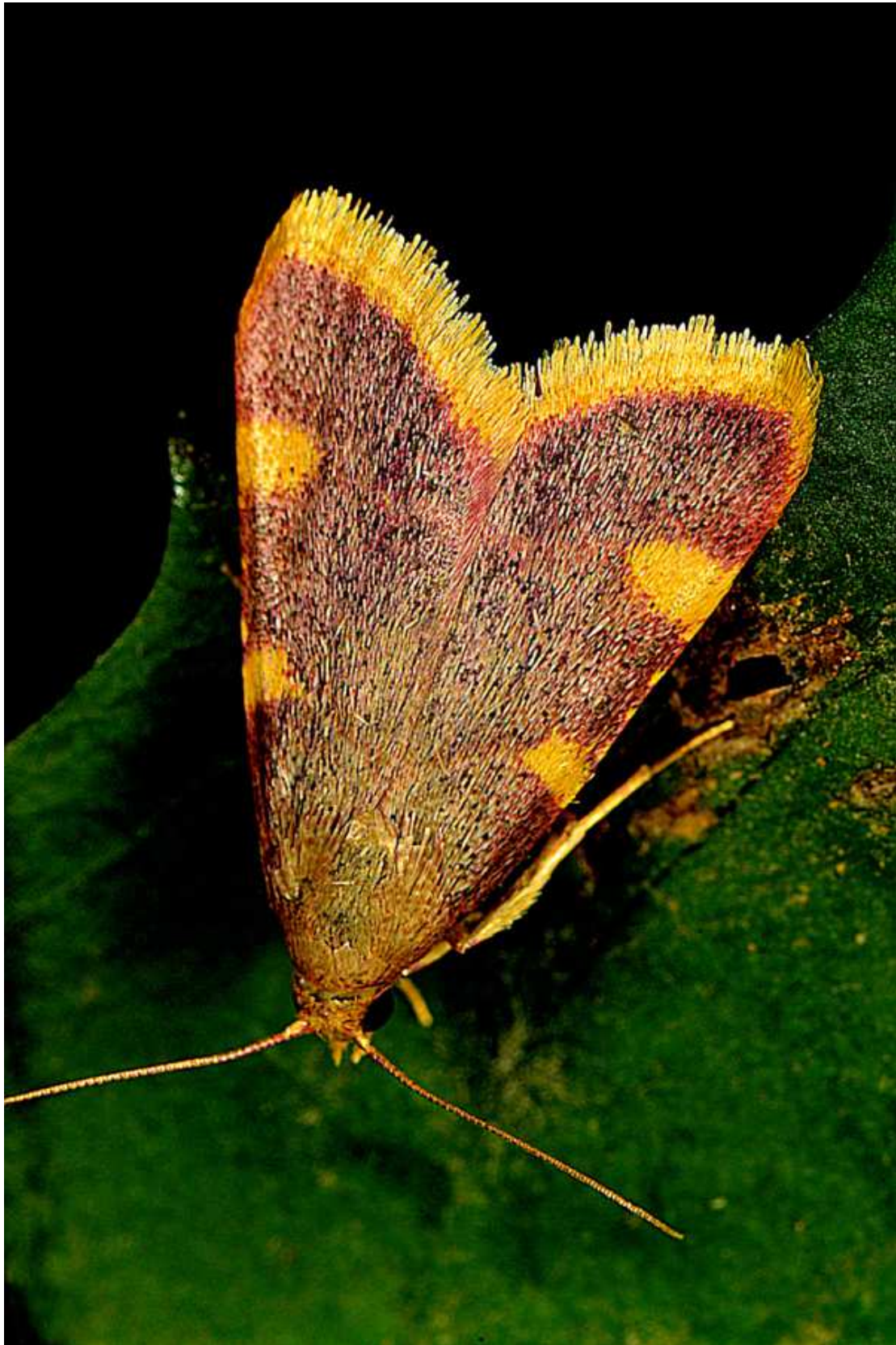
Hypsopygia costalis (Fabricius, 1775) – Pyralidae