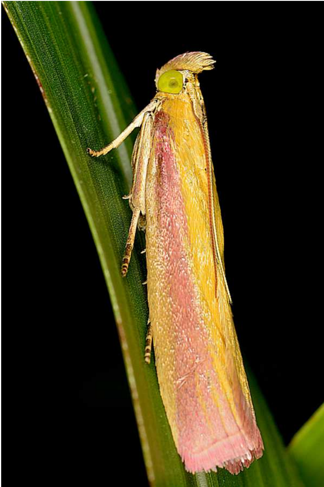
Oncocera semirubella (Scopoli, 1763) – Pyralidae