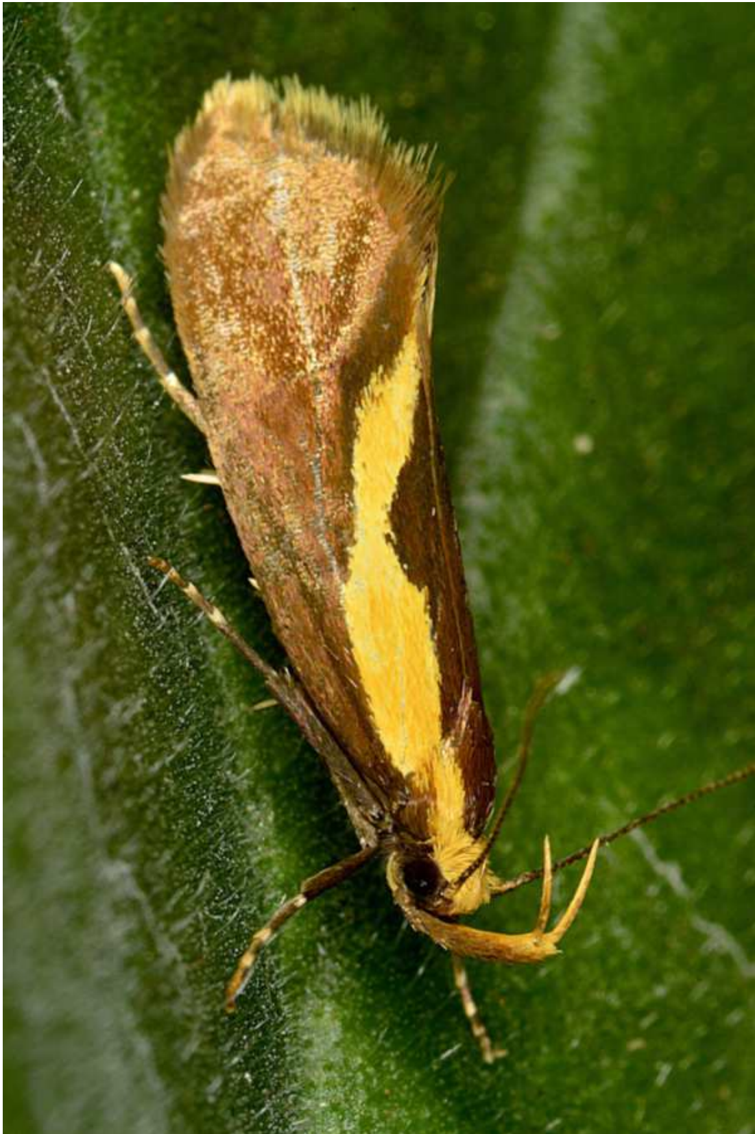
Harpella forcicella (Scopoli, 1763) – Oecophoridae