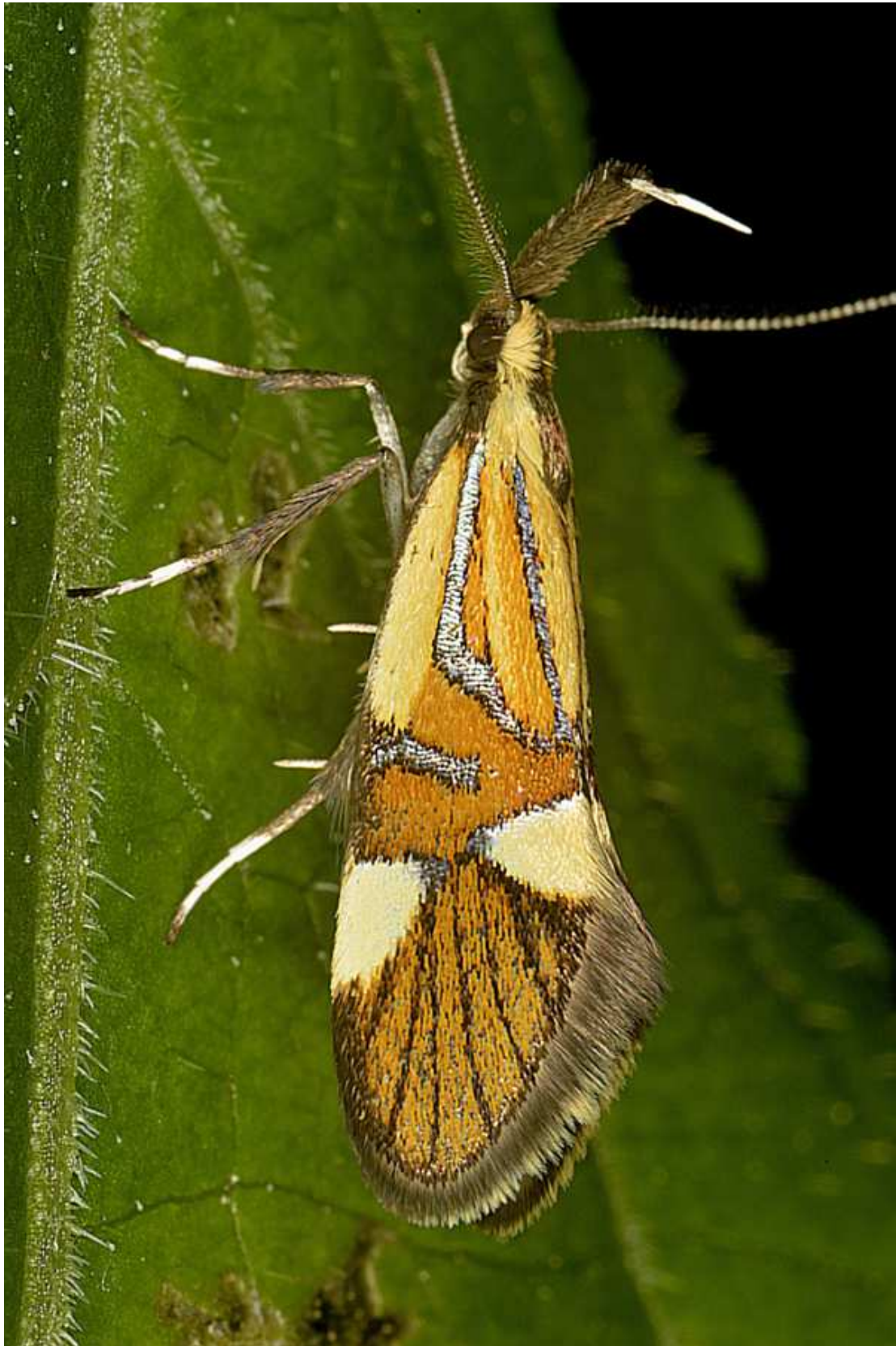
Alabonia geoffrella (Linné, 1767) – Oecophoridae